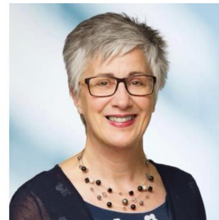
Anne Varenne Buch bei Frauenfeld